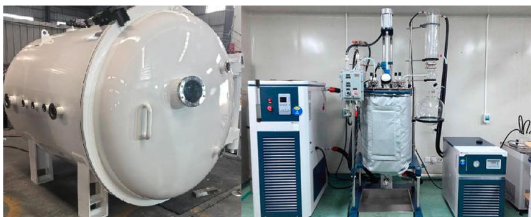
图 1 低温腔系统

超低温和超高温腔为航空航天设备及其他部件等行业提供模拟测试条件，测试包括性能试验和寿命试验等，测试均需高温测试、低温测试和常温测试，在一定环境和介质温度条件下为测试部件提供稳定压力、流量的油源。整套设备分为供油系统、控制阀组、操作台架和环境箱组成。