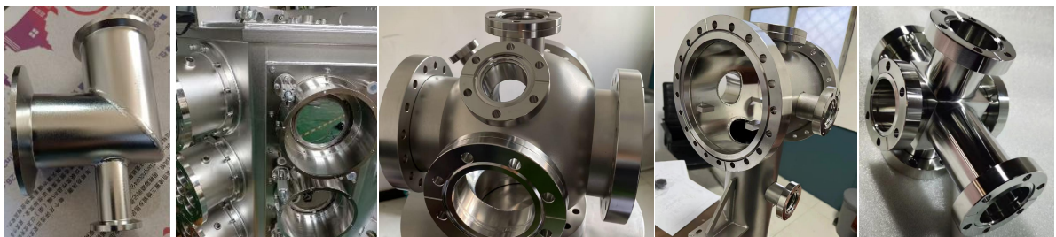
图 1 典型结构案例